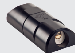
ARMADLOCK zajištění dodávkových vozů a garáží